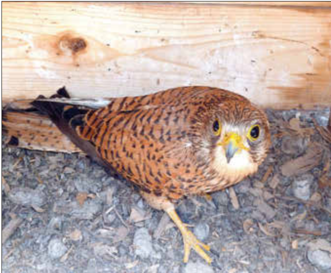
Ein Turmfalke ist eingezogen