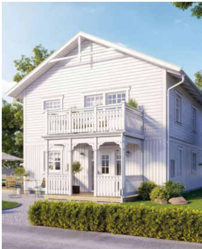
Ob ein- oder zweigeschossig, die Schwedenhäuser zeichnen sich häufig durch großzügige Veranden und Balkone aus.

wie Eksjöhus moderne Technik und hohe Energieeffizienz hinzu. Der Hausbauer aus Schweden verfügt über mehr als 75 Jahre Erfahrung und bietet eine große Bandbreite an Varianten, vom Bungalow bis zum Landhaus mit zwei Etagen und viel Platz für die Großfamilie. Auch für besondere Grundstücke zum Beispiel in Hanglage gibt es unter www.eksjohus.de passende Lösungen.