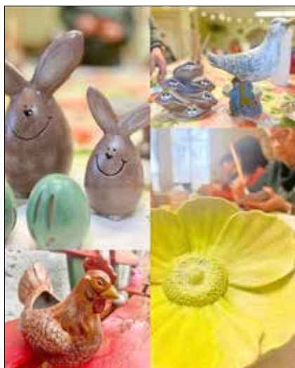
Individuell gestaltete Keramikstücke

Bowlingabend in Friedland. 25 sportbegeisterte Clubmitglieder und Nichtmitglieder genossen ein leckeres Abendessen in der Mecklenburger Bierstuvv, bevor an den vier Bowlingbahnen der sportliche Kampfgeist geweckt wurde. Wir gratulieren den drei Erstplatzierten Manni, Carmen und Dieter ganz herzlich. Und weil es wieder so schön war, ist der nächste Bowlingabend bereits für den 21.11.2026 festgelegt.