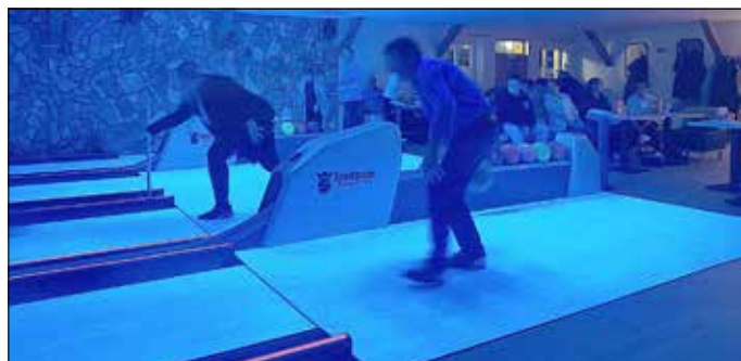
Voller Einsatz beim Bowling