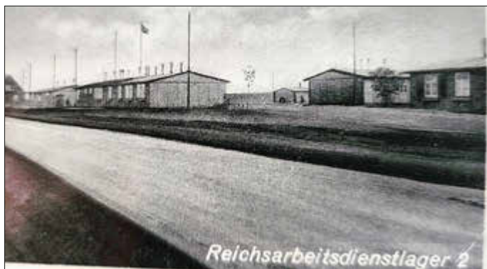
Ein Kauf aus Privatbesitz von Siedenbollentin

Der Name mag überraschen – schließlich war Schliemann ein Archäologe, kein Soldat. Doch im Geist der damaligen Zeit wurde er als Sinnbild für deutschen Fleiß und Entdeckergeist vereinnahmt. Ich möchte in dieser Folge nicht auf die Bedeutung und die Aufgabenstellung des RAD eingehen, nur zur Erinnerung, dass in unmittelbarer Nähe unserer Häuser – im Bereich des heutigen Neverin Verwaltungsbereiches so ein Lager stand und nicht alles zum Wohl der dort leben und arbeitenden Menschen geschah. Nach 1945 verschwanden diese Lager schnell aus dem Ortsbild – doch ihre Spuren sind immer noch gegenwärtig, in den Karten, in Dokumenten und in Erinnerungen. Am Neddemin Ausbau