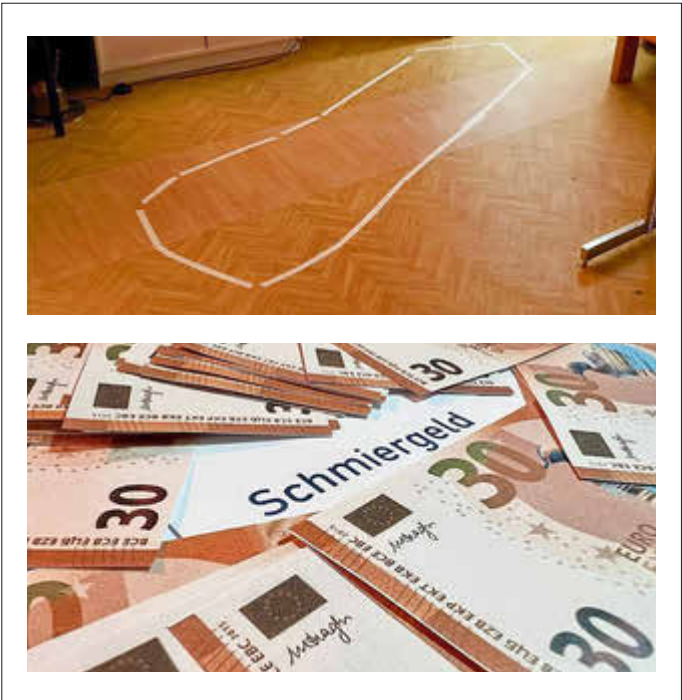
Der Abend hat Spuren hinterlassen