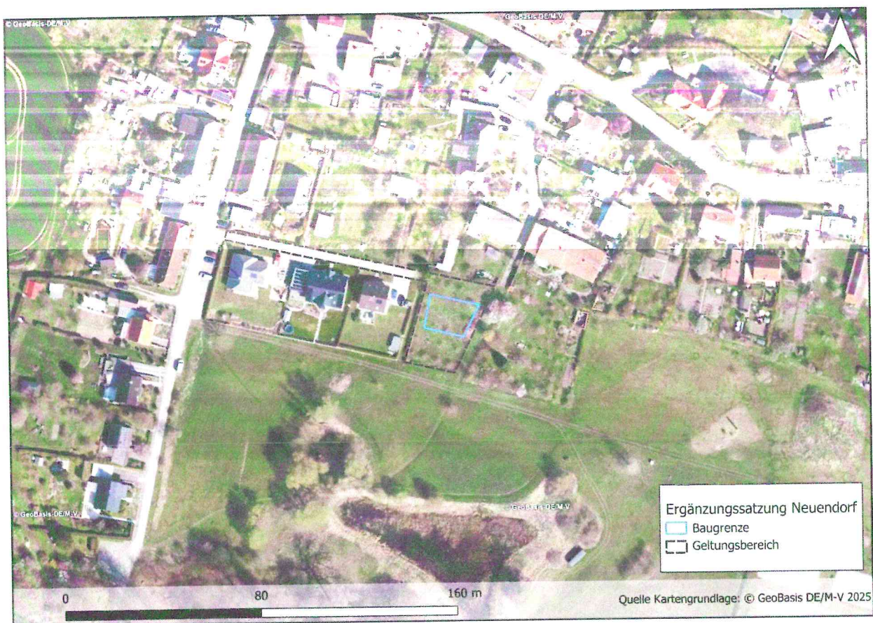
Abbildung 1: Vorhabenstandort Ergänzungssatzung Neuendorf

Der Geltungsbereich der 1. Ergänzungssatzung umfasst Teile der Flurstücke 75, 76/2, 76/3 und 78 in der Flur 6 der Gemarkung Neuendorf. Er liegt am südwestlichen Ortsrand von Neuendorf und erstreckt sich über eine Fläche von ca. 0,1 Hektar. Der einzubeziehende Bereich befindet sich etwa 100 Meter entfernt vom Gebiet von gemeinschaftlicher Bedeutung (FFH-Gebiet) „Tollensesee mit Zuflüssen und umliegenden Wäldern“ (DE_2545-303).